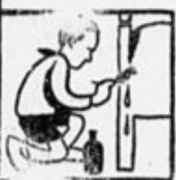
А вот горячей водой с керосином или эссенцией так будет

равой (лучше всего сура) и посыпают там, где эти тараканы собираются. Можно им устраивать ловушки: берут большой таз или ящик, на дно кладут кусок какой-либо пищи и оставляют на ночь. Затем их в миске обваривают кипятком.