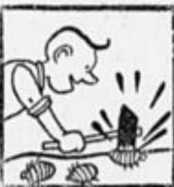
Мастер на все руки.—Молотом клопов не выведи.

С ними можно бороться кипятком так же, как и с клопами. Кроме этого берут сахарный песок, толкут его, смешивают с от-