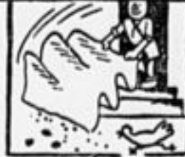
Ну, и физкультурники!

резать болезнь. Такие ужасные болезни, как сыпной и возвратный тиф, передаются таким путем.