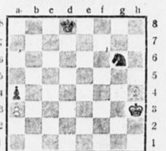
Диаграмма № 1. РАСПОЛОЖЕНИЕ ФИГУР.

Белые: Кр h3, Чл4, пешка a3. Черные: Кр d8, Кг6, пешка a4. Чл4 объявляет «шах» королю, стоящему на d8. Здесь возможны все три случая защиты: