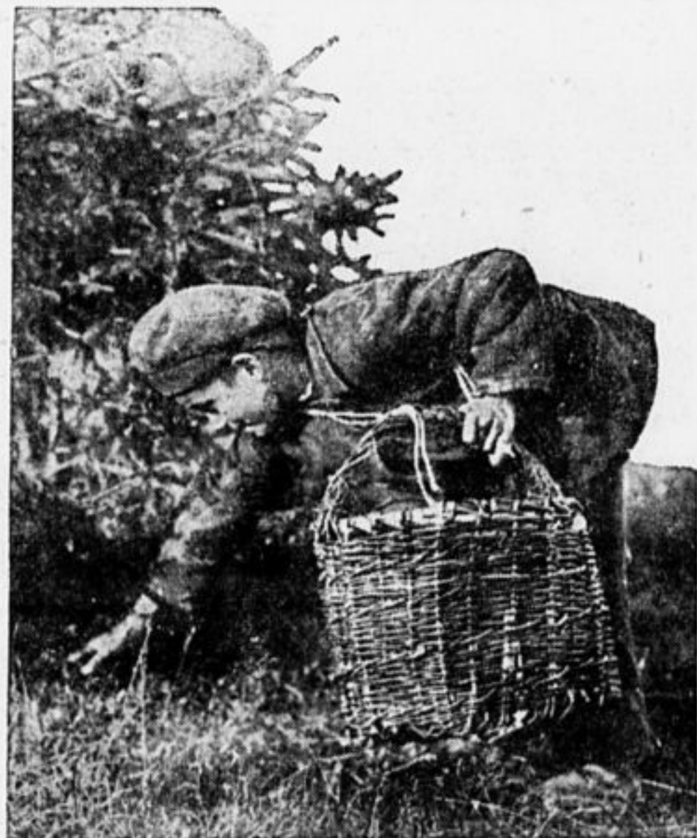
Третьего дня гриб подрезал, а он тут как тут.